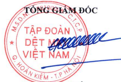
Cao Hữu Hiếu