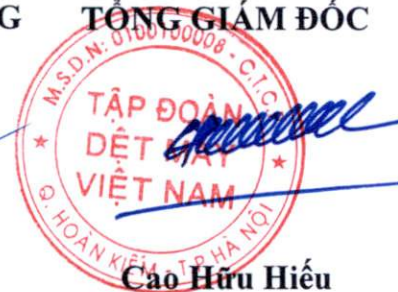
Cao Hữu Hiếu